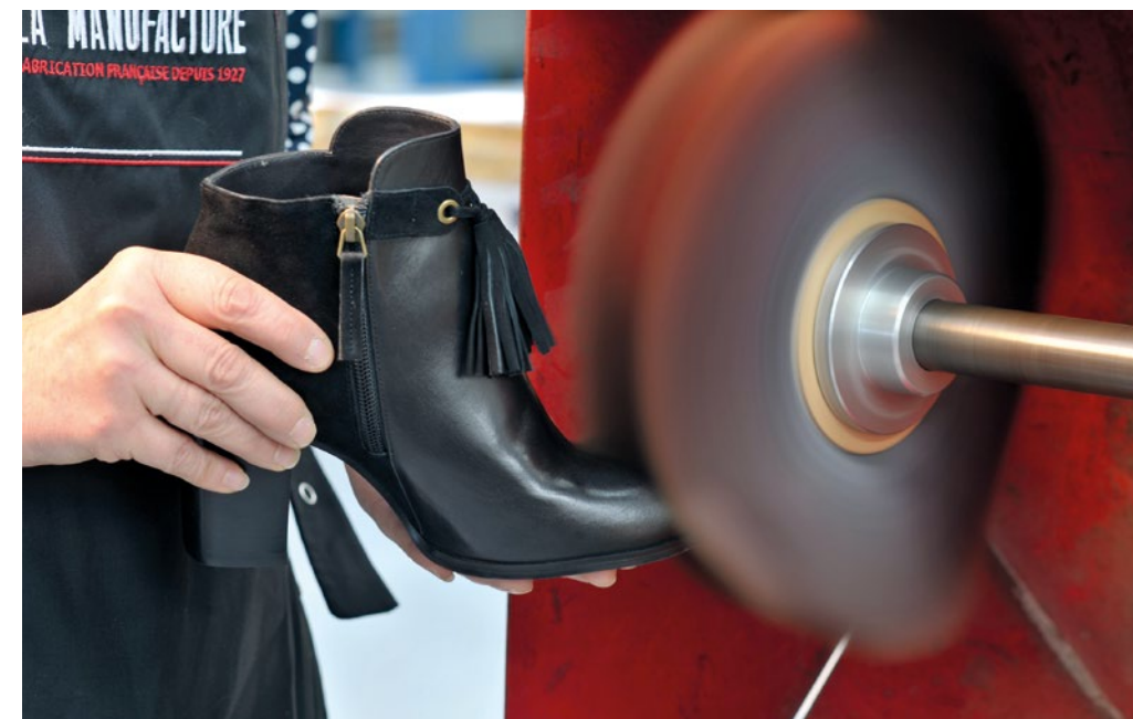
La Manufacture - Atelier de fabrication à Montjean-sur-Loire.

Personne ne devait rester sur le bas-côté de la route. C’est ce que notre grand-père illustrait volontiers par l’une de ces phrases qu’il nous a transmises : « Faire le bien et bien le faire ». « Bien le faire », car formé très jeune à la cordonnerie-botterie, il avait l’obsession du travail bien fait, du geste précis qu’exige le métier de fabricant de chaussures. Il avait tout autant la volonté de rendre la mode accessible au plus grand nombre. Il appliquera consciencieusement, tout au long de sa vie professionnelle, ces principes fondateurs sur lesquels il a bâti l’une des plus importantes entreprises de fabrication et de commerce de chaussures en Europe. Malgré cette réussite, il ne se départira jamais d’un mode de vie simple et frugal qu’il appliquera aussi à tout un chacun dans son entreprise. Nous pensons que c’est à la fois son sens de l’économie et son attachement à ses salariés qui ont permis cette aventure, désormais rare, d’une entreprise guidée par le bien commun et qui se développe en réinvestissant l’intégralité de ses profits.