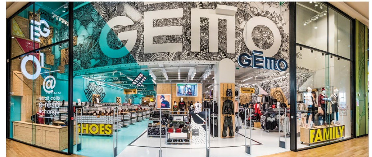
Magasin Gêmo à Basse Goulaine.

“— Notre mission est de favoriser l'épanouissement de chacun à tous les moments de sa vie. Nous voulons être reconnus pour nos performances responsables.”